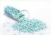
PET Bleu Clair