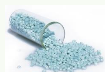
PET Bleu foncé