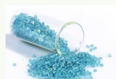
PET Bleu foncé