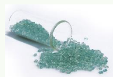
PET Bleu Clair